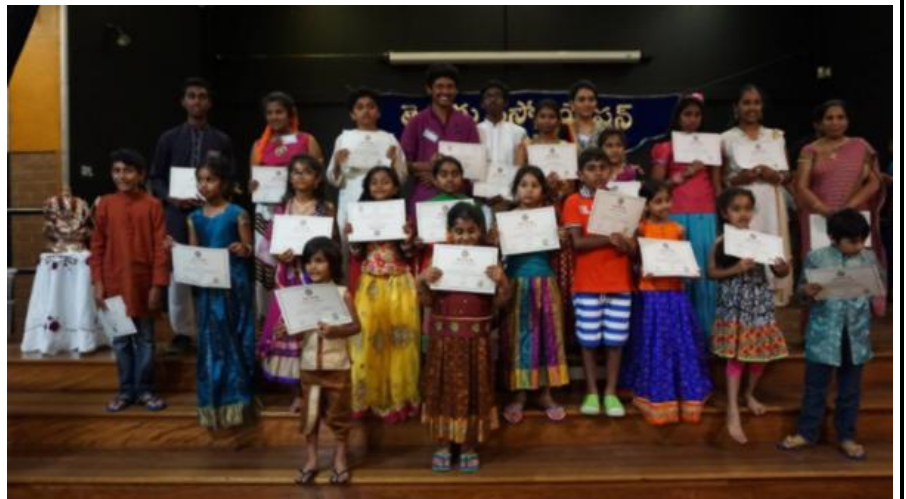
Strathfield South Public School Strathfield South