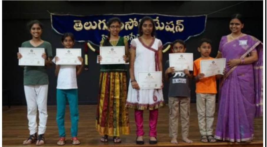
Holsworthy Public School Holsworthy