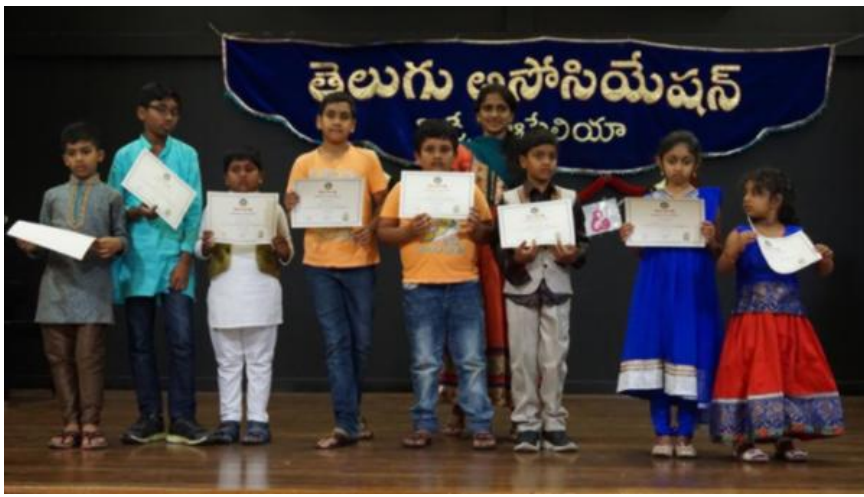
Darcy Road Public School Wentworthville