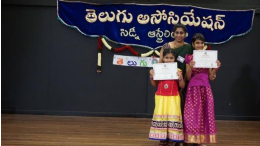
Eastwood Public School Eastwood